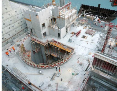
Schacht Stahlhallenmontage, Tierfehd