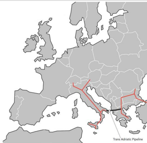
Trans Adriatic Pipeline