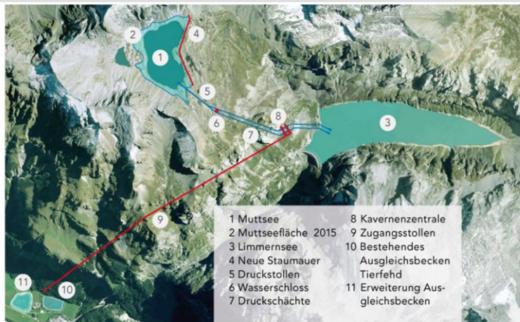
Projektüberblick Linthal 2015