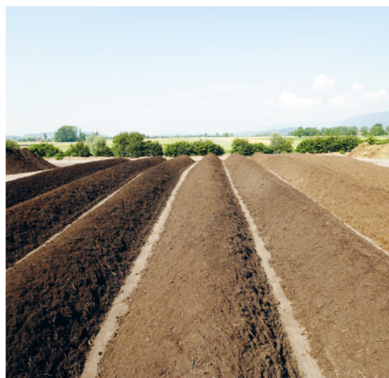
Longues rangées d'«andains» sur le site de compostage d'Axpo Biomasse SA de Granges

Les déchets verts broyés et non méthanisables sont entassés en de longues rangées d'«andains» sur les différents sites de compostage. Des machines retournent ces andains plusieurs fois par semaine afin d'oxygéner et d'humidifier le compost pour optimiser le processus de décomposition. La procédure est suivie par des experts, qui prélèvent régulièrement des échantillons pour contrôler la composition du compost. Les différents produits compostés peuvent être utilisés de multiples façons en jardinage ou en agriculture.