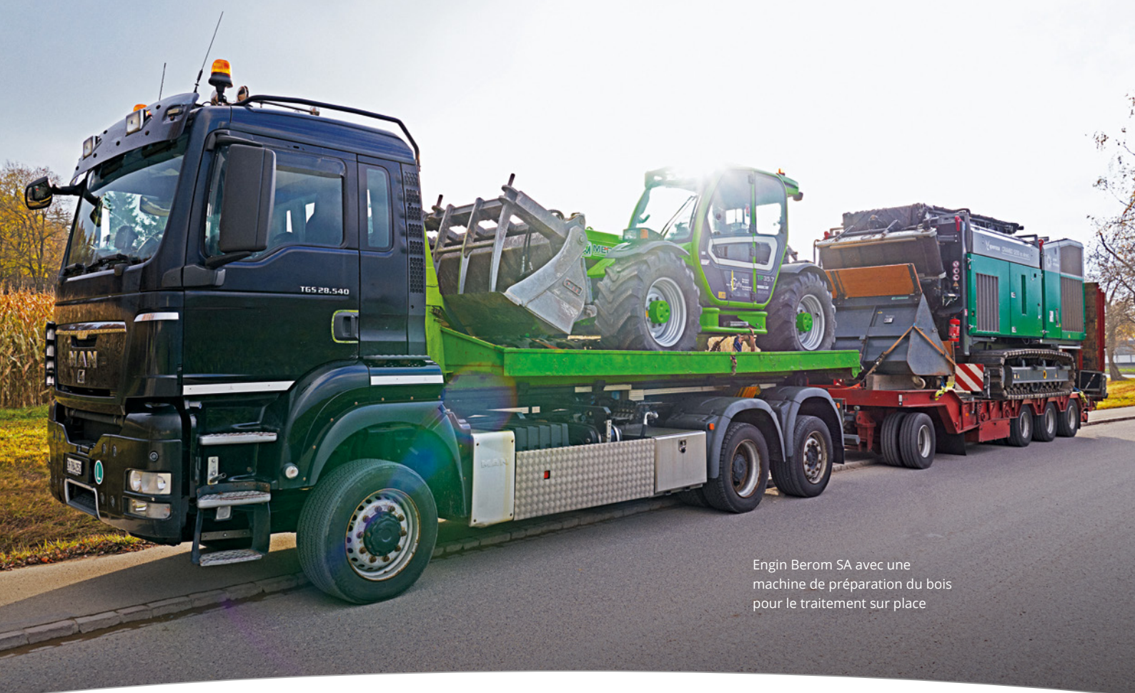
Engin Berom SA avec une machine de préparation du bois pour le traitement sur place