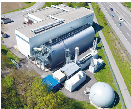
Komlogas Winterthur SA: usine de méthanisation avec son digesteur et son installation de production et de stockage du gaz

Le digesteur est la pièce maîtresse de toute usine de méthanisation. C'est dans cette cuve que méthanisent les déchets organiques préalablement broyés. En milieu anoxique, la biomasse est transformée en un biogaz riche en énergie grâce à des micro-organismes et une température constante de 55 °C. Ce procédé dure 14 jours et permet de produire de l'électricité et de la chaleur. Après une brève phase de traitement, ce gaz est directement injecté dans le réseau de gaz naturel qui alimente entre autres les stations-service où s'approvisionnent les véhicules fonctionnant au gaz. Le digestat est transformé en engrais naturel liquide et solide, ceux-ci sont certifiés pour l'agriculture biologique.