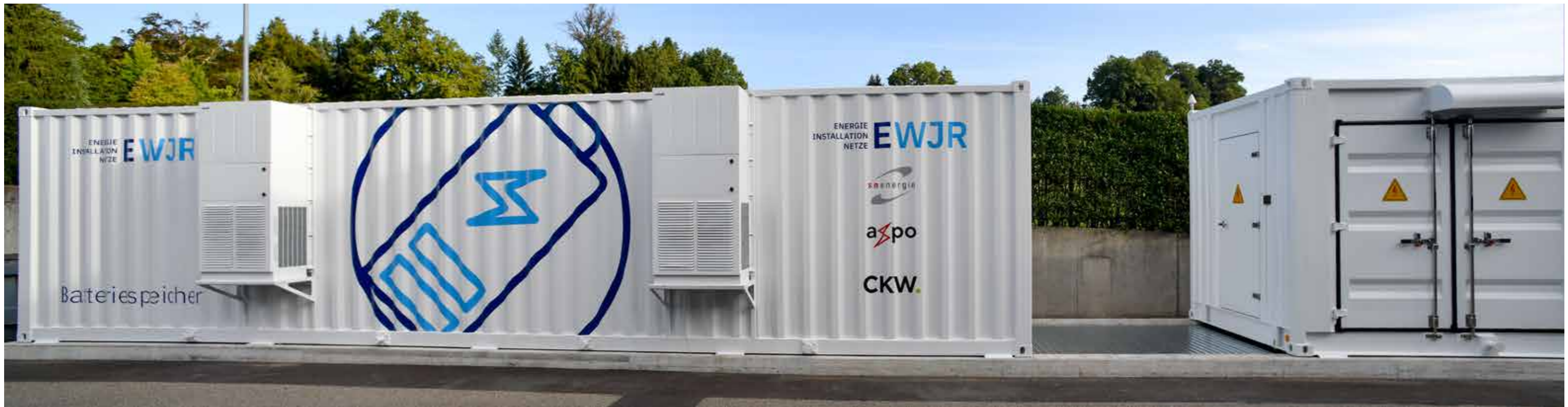
Axpo Batteriespeicher 2 MW / 2,17 MWh, Realisierung 2019, Endkunde Elektrizitätswerk Jona-Rapperswil AG (EWJR), Schweiz